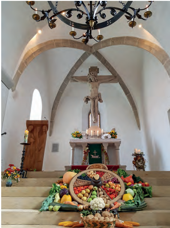
Erntedankaltar Großsorheim 2019

Noch im 16. Jahrhundert wurden beide Orte evangelisch. Seit etwa 175 Jahren gehören die beiden Ortschaften kirchlich zusammen. Die Kleinsorheimer hatten ein ansehnliches Pfarrhaus mit Stadel und Waschhaus gebaut und sich von der Verbindung mit Untermagerbein gelöst. Zusammen mit Großsorheim, das vorher zur zweiten Pfarrstelle von Harburg gehörte, bilden sie nun eine Pfarrei. Politisch gehören die Ortsteile zu Möttingen und zur Stadt Harburg (Schwaben).