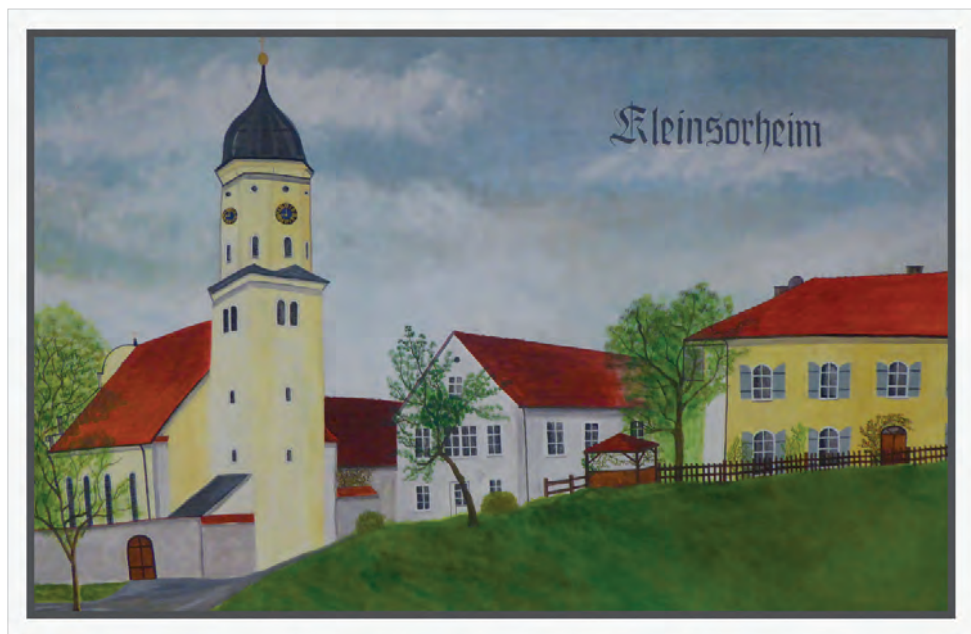
Kirche, Gemeindehaus und Pfarrhaus in Kleinsorheim gemalt von Eckhard Beck († 2017) aus Möttingen