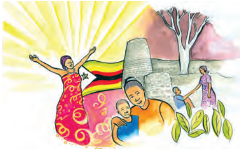
Titelbild zum WGT 2020 mit Bildtitel: „Rise! Take Your Mat an Walk“, Bild: Nonhlanhla Mathe © Weltgebetstag der Frauen – Deutsches Komitee e.V.

„Ich würde ja gerne, aber...“ Wer kennt diesen oder ähnliche Sätze nicht? Doch damit ist es bald vorbei, denn Frauen aus dem südafrikanischen Land Simbabwe laden ein, über solche Ausreden nachzudenken: beim Weltgebetstag am 6. März 2020.