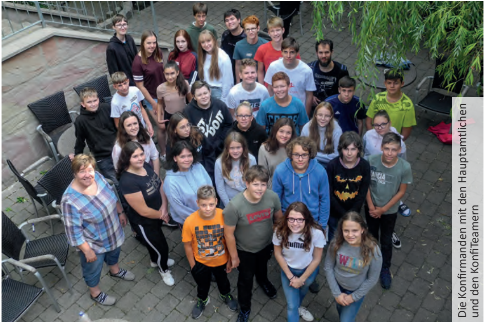
Die Konfirmanden mit den Hauptamtlichen und den KonfiTeamern

In zwei Unterrichtsgruppen werden die Konfirmanden zur Konfirmation hingeführt.